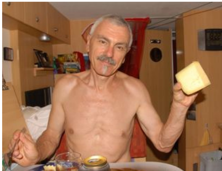
Käse für SFr. 7.46

In Venezuela einzukaufen kann sehr teuer sein oder spottbillig je nach dem was eingekauft wird. 400 gr. Käse, der nicht einmal schlecht schmeckt, kosten 56 Bolivares.